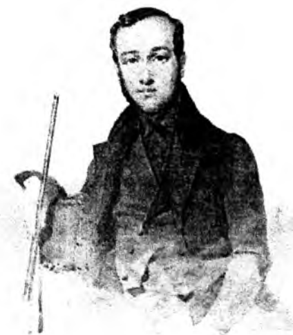
11. ПОРТРЕТ Є. П. ГРЕБІНКИ. Акварель. 1837.

Характерною рисою портретів, які Шевченко створив у 30-40-х роках XIX ст., є представництво тієї чи тієї соціальної групи. Звідси проглядаються офіційність поз, психологічна врівноваженість, спокійний, проникливий погляд, вираз зосередженості на обличчі таких портретованих осіб, як Є. Гребінка, А. Лагода, О. Коцебу, М. Катеринич, І. Лизогуб.