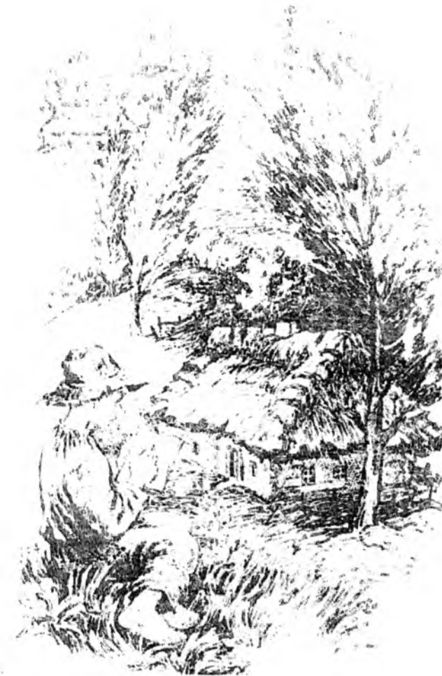
Дитинство Тараса Шевченка за повістю С. Васильченка «В бур'янах». Художник Л.В. Ільчипська

Промовистими в цьому плані є його слова: «Дякую Тобі, всемогутній Боже, що Ти обдарував мене почуттям людини, яка любить і бачить (усе) прекрасне й довершене у Твоїм нерукотворнім безконечнім творінні. Якби краса в усіх її проявах хоч би на половину людства мала добродійний вплив, тоді б ми швидко наближались до досконалості, і на решті втілили б собою божественну заповідь нашого Божественного Учителя» [3, т.4, с.260].