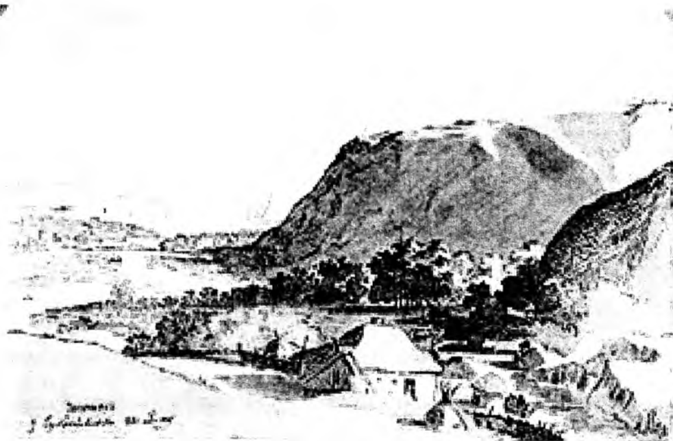
«Чигрин з Суботівського шляху»

До циклу суботівських зарисовок примикають акварелі, які Кобзар виконав у Переяславі – місті, де народився Б. Хмельницький і де 6 січня 1654 року відбулася історична Переяславська рада. Свої враження від побаченого в цьому місті художник висловив у своїх російських повістях, вірші «Сон» («Гори мої високі») (т.2, с.24) та листах (т.6, с.69), а також передав на акварелях. У Переяславі Шевченко змалював аквареллю Вознесенський собор «прекрасной, грациозной, полурукоко, полувизантійской архітектури, воздвигнутый анафемой, Іваном Мазепою, в 1690 году». Тут, крім цього собору, він увіковічив на своїх акварелях і церкви Покрови і Михайлівську церкву.