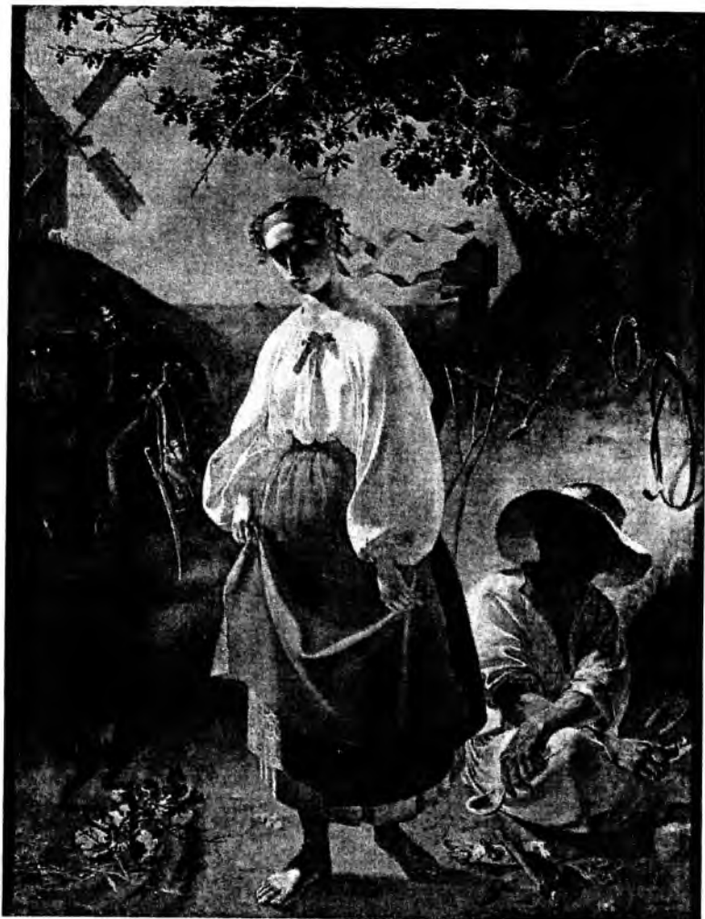
Катерина. 1842. [С.-Петербург] Полотно, олія

лочка дуба – відірваність від роду; зламаний колосок пшениці – знівечена доля людська.