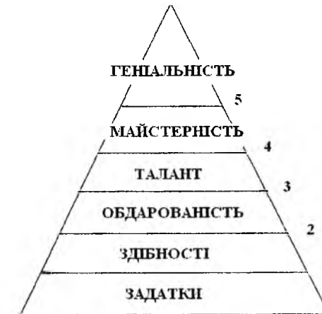
Рис. Етапи розвитку здібностей особистості

Тобто на переході від першої до другої сходинки важливу роль відіграє емоційний складник – це вдовolenня від виконуваної діяльності, інтерес та заохочення з боку значущих осіб. При цьому останнє не головне, хоча є умовою створення позитивного соціального клімату для розвитку здібностей.