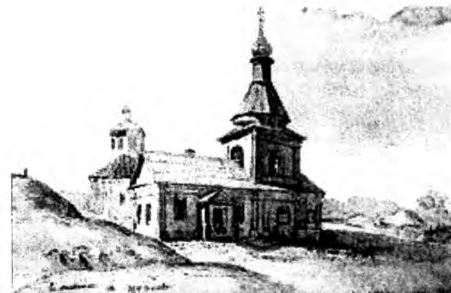
Т. Шевченко. Михайлівська церква. Акварель.

Вищепроаналізовані акварелі безпосередньо пов'язані з проектом Шевченкового видання «Живописної України». Крім них, художник у 1845-1847 роках виконав, як автор цього видання і як співробітник Київської археологічної комісії багато інших творів не тільки з архітектурними пейзажами, а й красвидами пам'ятних місць, пов'язаних з іменами видатних діячів російської та української культур. Насамперед ми маємо на увазі Шевченкові акварелі 1845 року, намальовані з натури в маєтку Гоголів-Яновських у с. Василівці-Яновщині (тепер с. Гоголеве Полтавської області). Це акварель «Урочище Стінка» (Олівець. 1845) і «Урочище Білик» (Олівець. 1845). У цих творах відображено мальовничі пейзажі неповторної краси.