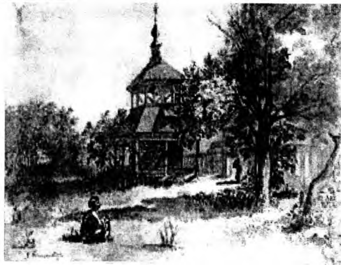
Т. Шевченко. У Василівці. Акварель

Щодо акварелі «У Василівці», то на ній чітко відтворено контраст між красою пейзажу і спотвореністю життя кріпака. Дійсно пейзаж із садом «У Василівці» сповнений сонця і повітря. Яскраво освітлені дерева кидають густі тіні на соковиту траву. А в центрі цього казкового краєвиду – оригінальна пам'ятка народної дерев'яної архітектури: старовинна триярусна дзвіниця з шатровою покрівлею і характерним опасанням на різьблених стовпах. Так прочитав малюнок «У Василівці» Л. Владич, і це не викликає заперечень. Проте прочитання, бо поза увагою цього дослідника залишився жебрак, що сидить на траві навпроти вхідної брами в маєток. Посередині брами – дворочий слуга, котрий проганяє жебрака. Природний контраст світла і тіні художник наклав на соціальний контраст добра і зла, багатства й убогості.