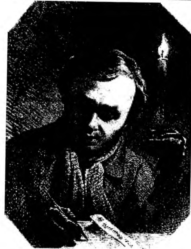
Т. Г. Шевченко. Автопортрет 1840 р.

Однак, за висновками Д. Степовика, в інших портретах, зокрема писаних олійними фарбами, митець послаблює офіційно-репрезентативну ноту і досягає точніших романтичних характеристик. Поворот голови до глядача і загадковий «елегійний» вираз очей, задумливість, стурбованість (автопортрет 1840 р., портрет Рудзинського 1845 р.), усмішка, сором'язливість, вивчаючий або ледь докірливий погляд в жіночих портретах: Закревської, Маєвської, Кейкуатової, Горленко. Жанрово-побутові ремінісценції (зокрема зображення людини, що розмовляє або когось слухає) в багатьох портретах, виконаних олівцем, кращим з яких можна вважати автопортрет 1845 року – такий діапазон настроїв, характеристик і почуттів» [63, с.130-131].