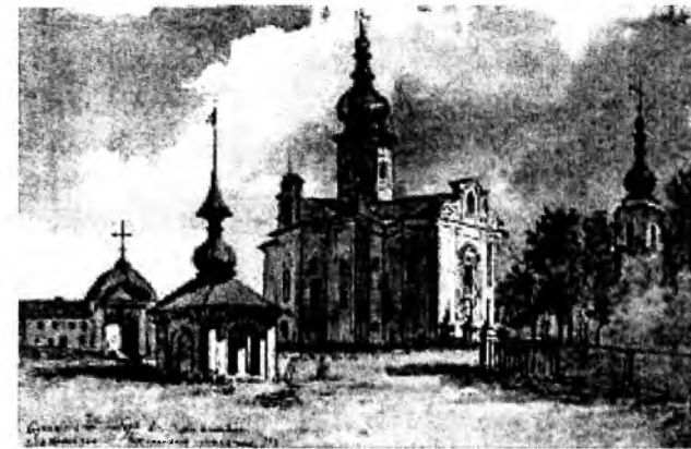
Т. Шевченко. Вознесенський собор у Переяславі. Акварель

Вираженням патріотичної та екологічної за сучасною термінологією ідеї є і такі його малюнки, як «Урочище Білик» (Олівець. 1845), «На Орелі», «Коло Седнева», етюди до офорта «У Києві» (1843) та інші пейзажні твори.