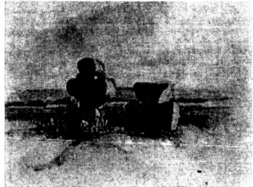
Тарас Шевченко. В Суботіві. Акварель. 1845

наміченого, сповненого повітря пейзажу-річки, яка спокійно тече в далечині, ці хрести здаються ще важчими.