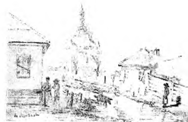
Т. Шевченко. Церква Покрови в Переяславі. Акварель