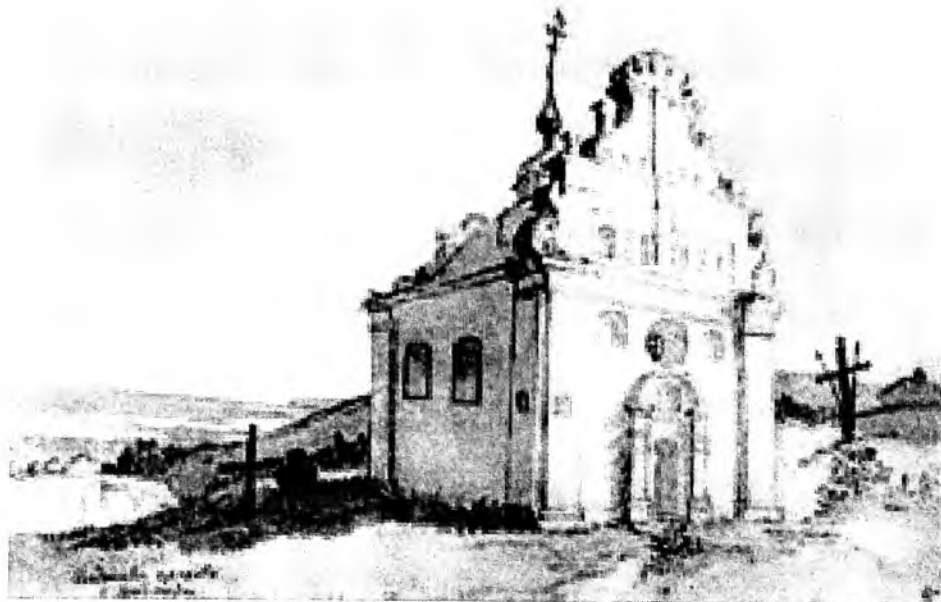
Тарас Шевченко. Богданова церква в Суботіві. Акварель. 1845

і світле в історії людства відбувалось на горі. Згадаймо хоча б гору Сіон та Нагірну проповідь Христа. І далі – західний фасад церкви яскраво освітлений і передає нам відчуття життєдайної теплоти, неначе материнського серця та батьківського піклування. Це Шевченкова душа покривала Суботів і всю Україну світлом любові та високих помислів. Цей фасад, прикрашений могутніми пілястрами й примхливим різьбленим фронтоном, створює виразний контраст із затіненим бічним фасадом. Неперевершений майстер світлотіні зумів виявити характерні об'єми будівлі, її рельєфне оздоблення, а водночас і надати малюнкові особливого настрою. Кам'яні і дерев'яні хрести навколо церкви похилені, по під стінами виріс бур'ян. Усе це посилює відчуття нашої героїчної давнини в цьому історичному краєвиді.