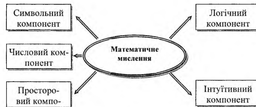
Рис.2. Складові компоненти математичного мислення

совувати такі операції, що в подальшому прислужаться людині в будь-якій мисленнєвій діяльності, в зокрема технічній.