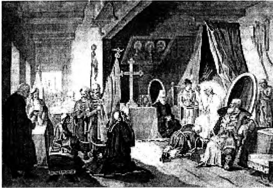
«Смерть Богдана Хмельницького»

1837 роках. Авторів було тоді ймовірно 23 роки. Не міг він знати, що це полудень його життя.