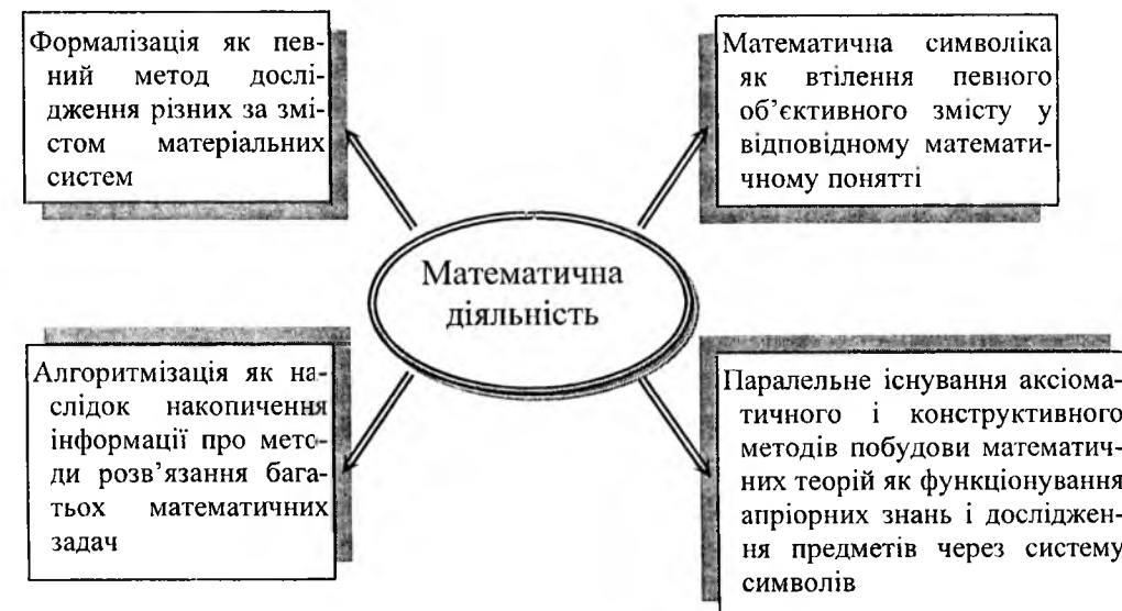
Рис.1. Основні особливості математичної діяльності

гальнення досвіду, а система уявлень, що відносяться до форми знання, яка передує досвідові і має принципово інше джерело свого походження. Вихідні математичні ідеалізації відрізняються від фізичних абстракцій лише тим, що вони відносяться не до світу досвіду, а до світу відношень, що проявляються через діяльність. Вони відображають категоріальні підрозділи і мають ніяк не менший стосунок до реальності, ніж закони фізики [2]. Це дає підстави вичленити основні особливості математичної діяльності (рис.1).