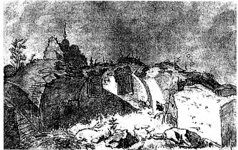
Тарас Шевченко. Богданові руїни в Суботові. Акварель. 1845

За руїнами, на другому плані, височить силует церкви Богдана Хмельницького. Неподалік – могутнє дерево, що вистояло перед вітрами історії і вірогідно було ровесником цієї церкви та свідком козацького життя, що колись тут вирувало. Простір на цій акварелі побудовано як контраст світлотіней. На світлоносні Богданові руїни з півночі насуваються чорні густі хмари. Шевченко відтворює акти безконечної драми неба. Борються, наступають один на одного пухнасті велетні купчастих хмар, намагаються затьмарити, заповнити собою світлий простір над Богдановою церквою і зруйнованим льохом. Тональність твору оптимістична: зруйновано лише льох, а церква і дерево вистояли, збереглися. Дух і життя народу збереглися, а це записка його світлого майбутнього.