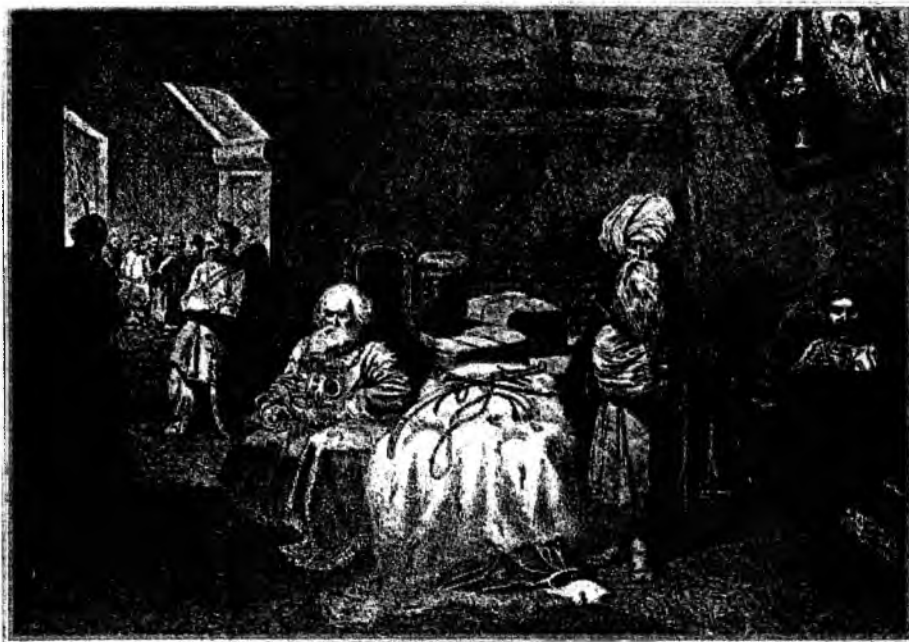
«Дари в Чигирині. 1649 року»

актові підписання Союзного договору між Україною і Росією – державами двох братніх народів. Психологію кожного з послів художник відтворив чітко й умотивовано. Він підштовхує глядача вгадати наперед хід подальших подій. На передньому плані – два послы двох могутніх на той час держав – Росії і Туреччини, за ними в кутку сидить посол польського короля. Турецький посол, сухорлявий, тонконогий старий у високій білій чалмі, явно схвильований: він стоїть, поглинутий думкою про те, як рішення козацької ради позначиться на долі його держави. Поза і обличчя польського посла виражають цілковиту безнадійність. Натомість у постаті боярина – посла російського відчуваються глибока свідомість своєї державної значущості й упевненість в успішному завершенні його дипломатичної місії. Наскрізна ідея офорта полягає в рішенні козацької ради єднатись з одновірним братнім російським народом.